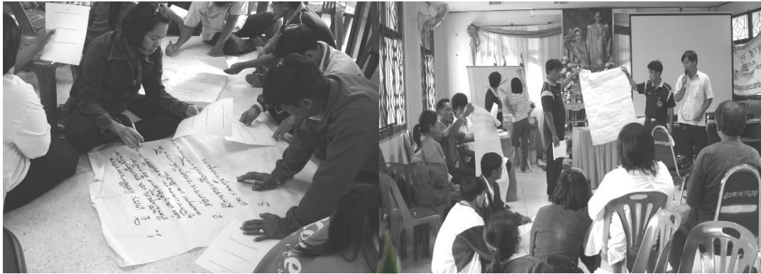
ภาพที่ 5.1 การสนทนากลุ่มย่อยของสมาชิกกองทุนสวัสดิการตำบลเขารวก

สมาชิกและกรรมการระบุว่า มีความพึงพอใจต่อการดำเนินงานของกองทุนสวัสดิการชุมชนตำบลเขารวกที่ผ่านมา ดังนี้